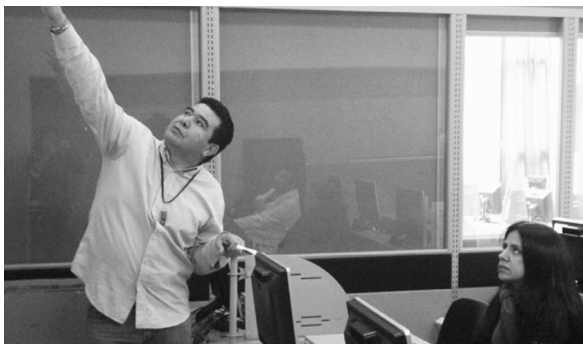
Reunión Comité de autoevaluación Facultad de Ciencias y Educación 29/04/11