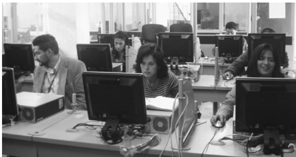
Reunión Comité de autoevaluación Facultad de Ciencias y Educación 25/02/11