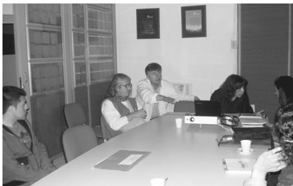
Reunión Comité de autoevaluación Facultad de Ciencias y Educación 13/05/11