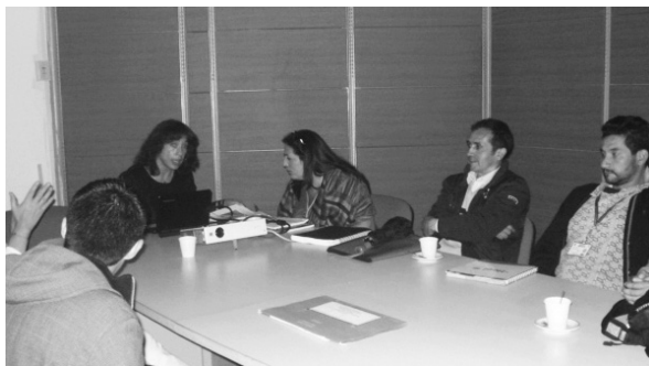
Reunión Comité de autoevaluación Facultad de Ciencias y Educación 13/05/11